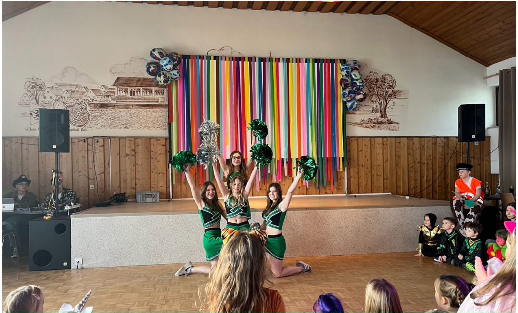
Cheerleader der Turnabteilung