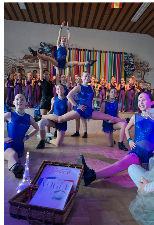
Jugendgarde des FCG