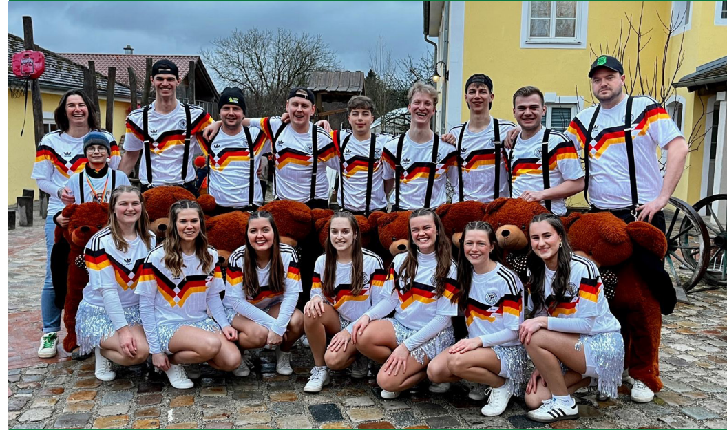
Die diesjährigen Toffibären und Toffifeen