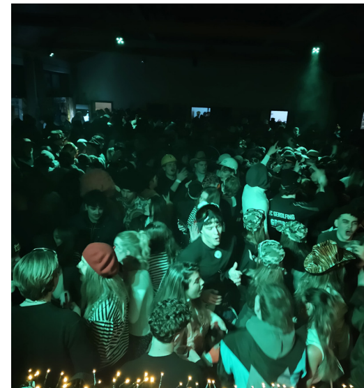
Volles Sportheim an Weiberfasching und Faschingsdienstag