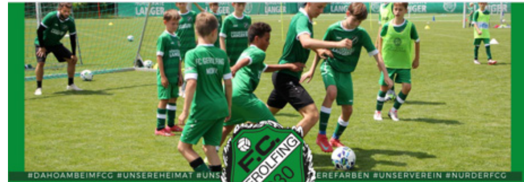
#DAHOAMBEIMFCG #UNSEREHEIMAT #UNSEREFARBEN #UNSEREVEREIN #NURDERFCG