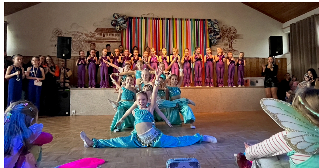
Kindergarde des FCG

Volkswagen Raiffeisenbank Bayern Mitte eG 0841 3105-0 www.vr-bayernmitte.de