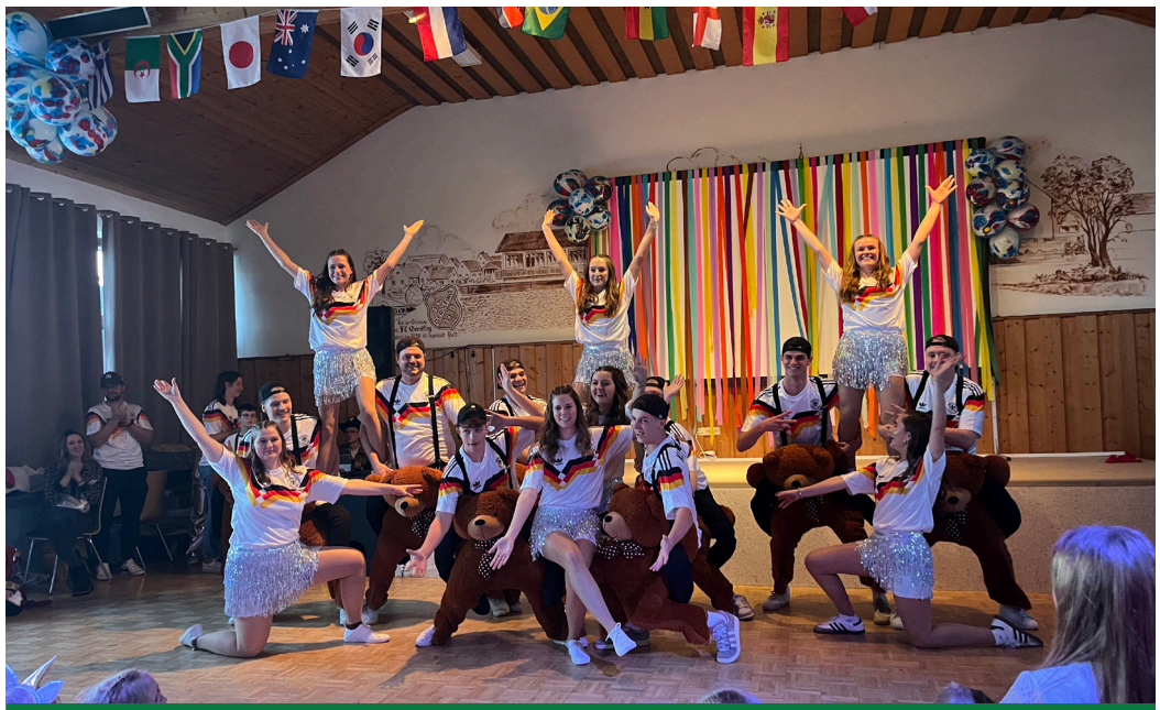
Die Toffibären und Tofffeen des FCG