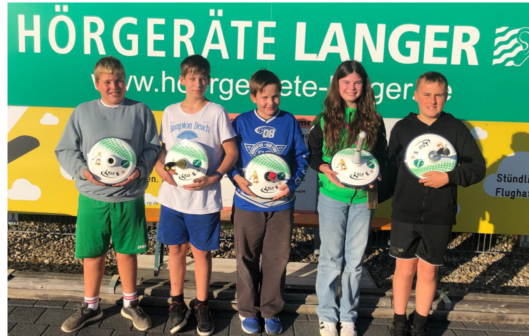
Stolz präsentieren unsere Jugendschützen Ihre neuen Eisstöcke. Unterstützt wurde der Neukauf der Eisstöcke durch das Jugendförderkonzept von der Firma Hörgeräte LANGER. Hiermit nochmal ein großes Dankeschön dafür!