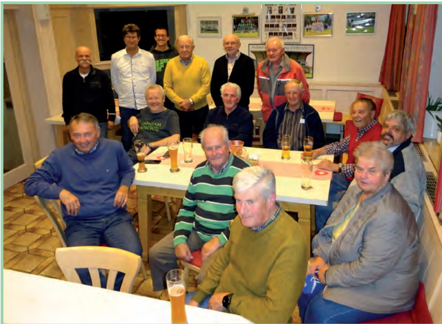
Im Sonnentzimmer inmitten der FCG-Trophäensammlung traf sich der Ältestenrat zur alljährlichen Runde.