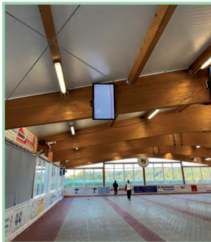
Geschossen wurde in der schönen Halle bei Wolfersdorf sogar mit „Video-Beweis“.

Und ein kleiner Ausblick: Das Silvester-Jedermann-Turnier wird traditionell am 30. Dezember 2021 bei uns auf den Stockbahnen ausgetragen. Wir würden uns sehr freuen, wenn wir Sie auf unserer Anlage als Gast oder sogar als neuen Schützen begrüßen könnten! Einfach mal vorbeikommen und den schönen Stocksport genießen. Das Training findet am Dienstag und Donnerstag jeweils ab 19:00 Uhr bei den Aktiven und das Rentnertraining am Montag ab 14:00 Uhr auf der Stockschützenanlage statt.